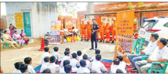
महेन्द्रगढ़। विद्यार्थियों को जानकारी देते हुए।