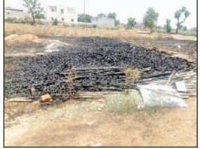
नारनौल। खेतों में जलकर राख हुए बांस।