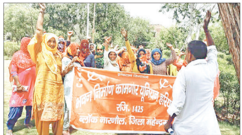
नारनौल। प्रदर्शन करते भवन निर्माण कामगार यूनियन के सदस्य।

तथा एक-एक वाटरटैंकर का वे 400-400 रुपये अदा करने का विवश हो रहे हैं। अन्यथा प्यासे मर जायेंगे। उन्होंने बताया कि जनस्वास्थ्य विभाग के अधिकारियों को सूचित किया तथा चंडीगढ़ तक के सरकारी नंबरों पर शिकायत दर्ज करवाई, लेकिन विभाग के कर्मचारी जब आते हैं, तब थोड़ी-बहुत देर पानी छोड़कर उसकी फोटो खींच लेते हैं और सरकारी नंबरों पर अपलोड करके इतिश्री कर लेते हैं, जबकि समस्या ज्यों की त्यों बनी हुई है। उन्होंने यह भी आरोप लगाया कि वाटर सप्लाई छोड़ने वाले कर्मचारी भी मनमानी करने में लगे हुए हैं और उन्हें पानी की आपूर्ति न देकर परेशान कर रहे हैं। उन्होंने प्रशासन से पीने का पानी उपलब्ध करवाने की मांग की है।