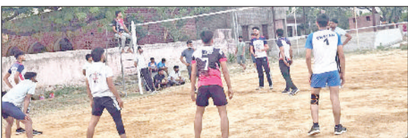
नारनौल। वॉलीबॉल प्रतियोगिता में भाग लेते खिलाड़ी।