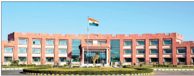
महेन्द्रगढ़। हरियाणा केंद्रीय विश्वविद्यालय का भवन।