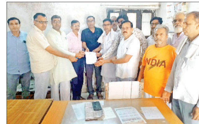
नारनौल। स्थापना सहायक को ज्ञापन देते रोडवेज कर्मचारी।