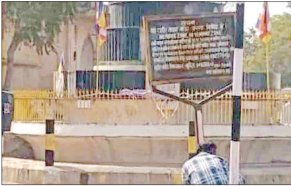
महेन्द्रगढ़। आंबेडकर चौक के पास नया पार्किंग बोर्ड लगाया गया।

नगर पालिका करीब तीन साल पहले शहर में लगवाए थे नो पार्किंग व नो वेडिंग जोन के बोर्ड। नगर पालिका करीब तीन साल पहले नो पार्किंग नो वेडिंग जोन के बोर्ड लगाए गए थे। इसके लिए प्रशासन ने रेहड़ी व गाड़ी चालकों को वाहन खड़े करने के लिए जगह भी निर्धारित की गई थी, लेकिन प्रशासन की अनदेखी के कारण अब वाहन बीच बाजार में ही इधर-उधर खड़े हो रहे हैं। इसके